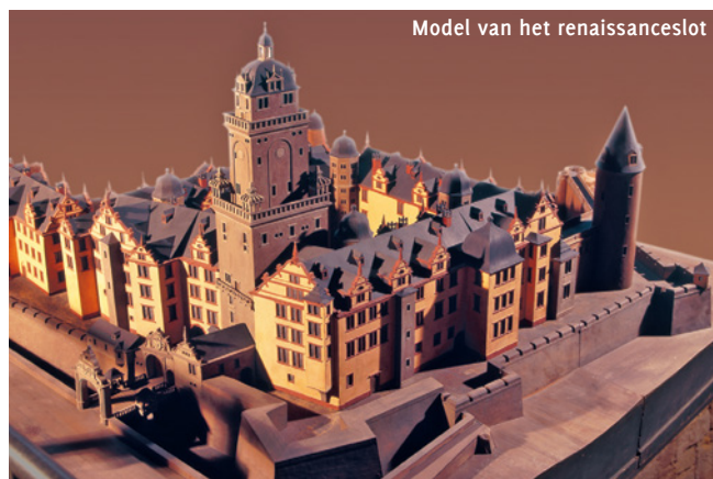
Model van het renaissanceslot

Het zuidoostelijke en zuidwestelijke bastion, twee verdiepingen tellende kazematten, kerkers en enkele militaire kelders kwamen uit de jaren 1563-1569.